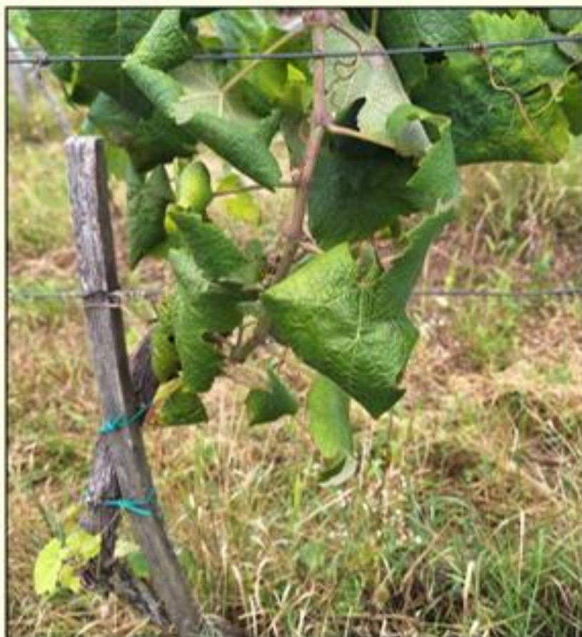
Žltnutie a typické stáčanie listov smerom nadol pri bielych odrodách viniča