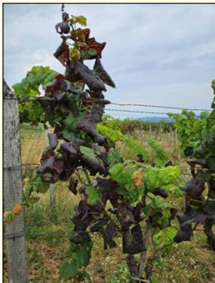
Na modrých odrodách viniča sčervenanie a stáčanie listov nadol