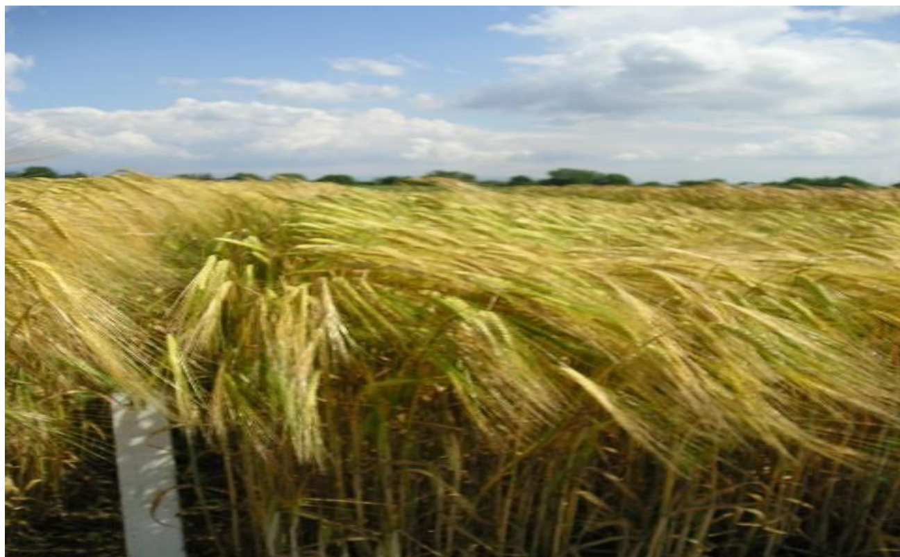
JÄČMEŇ JARNÝ Hordeum vulgare L.

Výsledky skúšok s registrovanými odrodami rok 2006