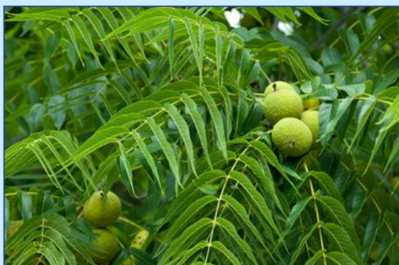
Orech čierny ( Juglans nigra )

Prvými príznakmi sú žlté listy, vädnutie lístia a rednutie koruny. Malé konáre môžu zožltnúť, postupne sú zasiahnuté väčšie konáre a odumierajú. Dominantný symptóm – z vetiev na jar opadávajú listy.