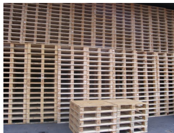
palety pripravené na sušenie

V prípade, ak nejaká časť obalového materiálu bola odstránená a nahradená novou drevenou časťou (pri opravách a reparácii), tento nový diel musí byť ošetrovaný a označený v súlade s ISPM 15. Po opravách obalového materiálu sa môže stať, že má obal viac označení, čo sťažuje identifikáciu pôvodného výrobcu. Z tohto dôvodu je nutné odstrániť pôvodné značky (napr. prekrytím farbou alebo zbrúsením) a celý obalový materiál znovu ošetriť a označiť v súlade s ISPM 15 a to len registrovaným a oprávneným výrobcom obalového materiálu z dreva.