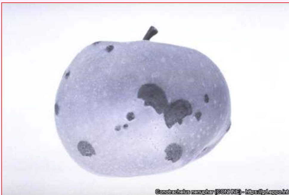
Jazvy na povrchu zrelého jablka po kladení vajíčok a požere

Po poškodení ovocia nosánikom môže dôjsť k napadnutiu hnedou hnilobou. Povrch ovocia môže byť zjazvený alebo zdeformovaný požerom a kladením vajíčok dospelcami nosánikov a kompletne celé ovocie môžu zasa zničiť larvy. Tie opúšťajú plody výstupnými otvormi, ktoré sa nachádzajú na spodnej strane spadnutého ovocia. Väčšina napadnutých plodov, okrem čerešní a višní, predčasne opadáva, ale tento jav môže byť čiastočne maskovaný bežným skorým opadom z fyziologických príčin. Čerešne môžu na stromoch hniť. Dospelce sa živia aj kvetmi, listami a mladými plodmi, avšak poškodenie požerom na listoch a kvetoch zvyčajne nie je významné. Neskôr môžu byť namiesto kruhových pozorované polmesiacové alebo polkruhové znaky kladenia vajíčok.