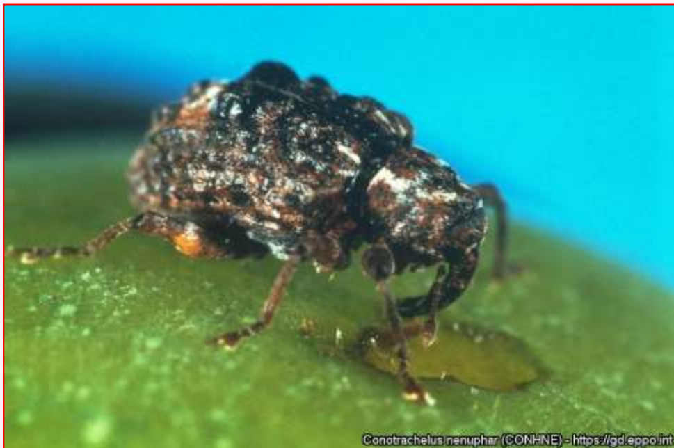
Dospelce Conotrachelus nenuphar na slivke a poškodenie spôsobené požerom

Okrem toho bol škodca pozorovaný aj na říbezliach ( Ribes spp.) a čučoriedkach ( Vaccinium spp.).